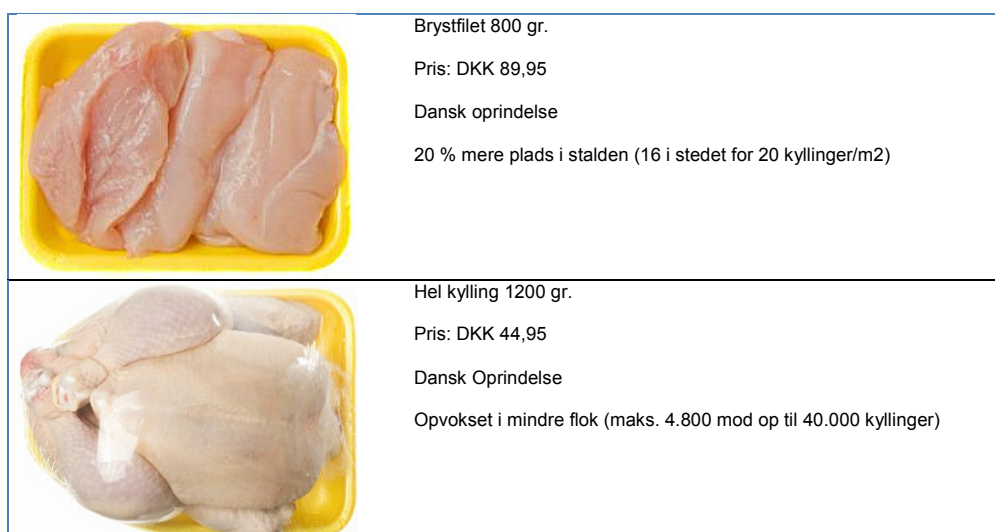
Figur 2. Som eksempler er vist fire af de 16 produktprofiler, som blev vurderet i den første del af undersøgelsen.

De konkrete dyrevelfærdsanprisninger, der blev anvendt, var de seks første i Tabel 2. For hver af disse (se eksempel i figur 2 nedenfor) blev respondenterne bedt (på en skala fra 1 (mindst) til 7 (størst)) om at angive deres købsintention og opfattelse af produktets kvalitet med hensyn til dyrevelfærd (intra-egenskab) samt smag og sundhed (inter-egenskab). Med henblik på at simulere og at undersøge betydningen af tidspress fik halvdelen af respondenterne i hver gruppe kun mulighed for at kigge på de enkelte produktprofiler i fem sekunder, før de skulle vurdere dem.